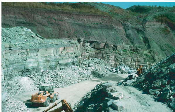
Abb. 1: Gipssteinbruch Hagenhof bei Rossfeld westl. Crailsheim (Foto: Herbst 2001). Deutlich ist der rasche laterale Wechsel von Gipssteinführung (in wirtschaftlich gewinnbarer Mächtigkeit) zu abgelaugten Bereichen - rechts im Bild - zu erkennen

In Baden-Württemberg werden gegenwärtig 1,3 Millionen Tonnen Sulfatgesteine in 22 Betrieben unter und über Tage abgebaut (Abb. 1). Der Gipssteinabbau ist aufgrund der natürlichen geologischen Gegebenheiten auf zwei Gebiete in Baden-Württemberg begrenzt, (1) das Gebiet Schwäbisch Hall-Vellberg-Crailsheim und (2) das Gebiet Rottweil-Herrenberg. Besonders die Firmen, die im Raum Schwäbisch Hall-Crailsheim seit 1950 zahlreiche Gruben und Werke betreiben, kämpfen um ihre Zukunft. Die Gips- und Anhydritsteingewinnung ist hier aufgrund nachlassender Rohstoffvorräte, sich ausdehnender Bebauung und der voranschreitenden Ausweisung von Naturschutz- und Landschaftsschutzgebieten, Biotopen und FFH-Gebieten besorgniserregend schwierig geworden. Der Kampf um weitere Abbaugelände beschäftigt Planer, Kommunen und Gerichte in zunehmenden Maße. Eine Einstellung der Gips- und Anhydritsteinförderung in der Region Franken und in deren Folge eine Verstärkung der Importe aus Gebieten außerhalb Baden-Württembergs würden nicht nur die Abhängigkeit und damit auch die Rohstoffpreise erhöhen, sondern auch zu stärkerer Verkehrsbelastung durch Ferntransporte und einem weiteren Verlust von Arbeitsplätzen führen.