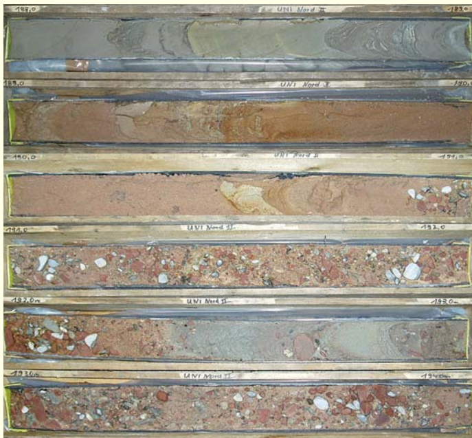
Bohrkerne des Teufenabschnitts 188 bis 194 m der Forschungsbohrung Heidelberg, Viernheim-Formation; nach ihrer Pollenführung wurden diese Sedimente in der frühpleistozänen Warmzeit Waal abgelagert.

Das Heidelberger Becken ist eine in der quartären Neotektonik des nördlichen Oberrheingrabens begründete Sedimentfalle. Es befindet sich ziemlich genau in der Mitte zwischen den alpinen Quellgebieten des Rheins und seiner aktuellen Mündung in die Nordsee. Es ist damit die zentrale Schlüsselstelle für die Süd-Nord-Korrelation. Zugleich liegt es am Ende des von der alpinen Klimadynamik gesteuerten Systems,