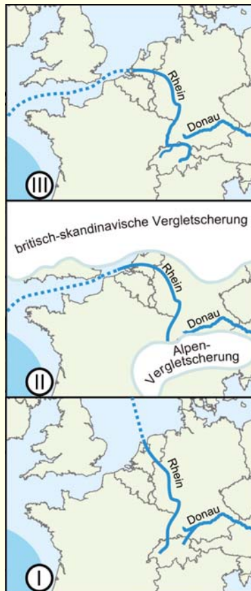
Entwicklung von Donau- und Rhein-Verlauf bei niedrigem und hohem Meeresspiegel (I: Frühpleistozän, II: Hoßkirch-Eiszeit, III: Heute).

das vom randalpin übertieften Bodenseeraum über das Hochrheintal bis in den südlichen Oberrheingraben mit seinen mächtigen Alpenschottern reicht. Das alpine Rheinsystem und der Sedimentinhalt des Heidelberger Beckens fügen sich zusammen zu einem einzigartigen Klima-Archiv des Quartärs, das nicht nur Klimaschwankungen, sondern auch die damit verknüpfte Geodynamik illustriert.