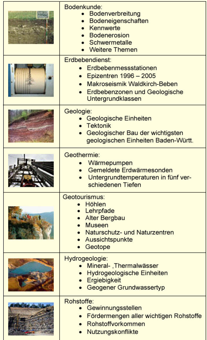
Tabelle: Übersicht über die Fachbereiche und Themen des LGRB-MapServers

Abbildung 1 zeigt die Einstiegsseite des LGRB-MapServers für die Themengruppe Rohstoffe. Die einzelnen Themen bzw. Ebenen werden übersichtlich in einer thematisch gegliederten Baumstruktur angeboten und können einzeln an- und ausgeschaltet werden. Die Legenden aller eingeschalteten