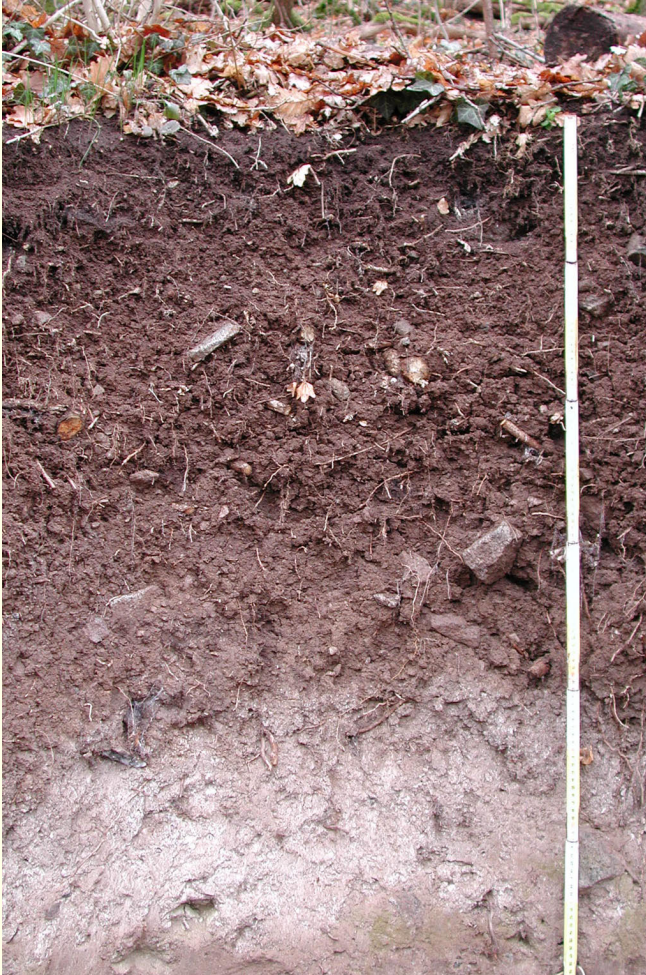
Abb. 2: Braunerde-Pelosol auf Tephrit — Büchsenberg

Die lössbedeckten Niederterrassenflächen werden ebenfalls von Pararendzina aus Löss, aber auch aus Sandlöss, dominiert. Auf den lössfreien Flächen kommen kiesige Parabraunerden mit intensiv rotbraunem Unterboden vor (Abb. 3). Im Westen der Freiburger Bucht sind die Böden dagegen großflächig unter Grundwassereinfluss entstanden. Auf dem Dreisamschwemmfächer finden sich Gleye, Pseudogley-Gleye und Gley-Pseudogley (Kartendarstellung violett bzw. hellgrau). Im Wasenweiler Ried sowie kleinflächig in der Freiburger Bucht führten ganzjährig oberflächennahe Grundwasserstände zur Ausbildung von Niedermoor im Wechsel mit Moorgley und Anmoorgley (grün). Im Überschwemmungsbereich entlang der Flüsse sind Auengley und Vega verbreitet (blau). Eingriffe in den Wasserhaushalt führten vielfach zum Absinken des Grundwasserspiegels. Reliktische Gleye sowie trocken gefallene und stark zersetzte Niedermoore sind die Folge.