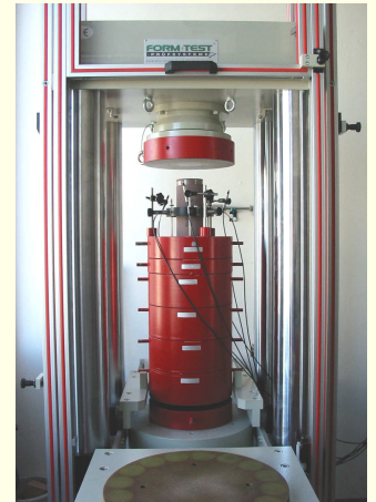
Abb. 1: Entnahme von Bohrkernen in Gelände zur Gesteinsprüfung (links) und Durchführung von felsmechanischen Untersuchungen im petro-physikalischen Labor des Geologischen Instituts der Universität Freiburg (rechts)

Beispiel Entstehung von Ganglagerstätten: Wie sind im Schwarzwald die hydrothermalen Anreicherungen von Erzen und Industriemineralen entstanden? In mehreren alten Bergbaurevieren des Schwarzwalds kartieren Diplomanden unter Anleitung des LGRB auch unter Tage (Abb. 2), um die Strukturgeologie der Gangstörungssysteme zu ermitteln. Kartiertechniken und