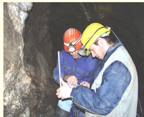
Abb. 2: Kartierung in einem historischen Silberbergwerk (Kinzigtal)

Beispiel Entstehung von Ganglagerstätten: Wie sind im Schwarzwald die hydrothermalen Anreicherungen von Erzen und Industriemineralen entstanden? In mehreren alten Bergbaurevieren des Schwarzwalds kartieren Diplomanden unter Anleitung des LGRB auch unter Tage (Abb. 2), um die Strukturgeologie der Gangstörungssysteme zu ermitteln. Kartiertechniken und