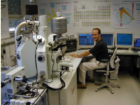
Abb. 3: Mikrosondenlabor (Universität Tübingen)

Die Untersuchungen der in den Mineralen seit ihrer Bildung enthaltenen Flüssigkeitseinschlüsse liefern Informationen über die Art und Herkunft der wässrigen Lösungen, aus denen die Erze gebildet wurden. Messungen von stabilen und radiogenen Isotopen dienen dazu, quantitative Modelle und eine Datierung der Lagerstättenbildung zu ermöglichen. Hervorzuheben sind hier die langjährigen Kooperationen mit den Universitäten in Tübingen, Clausthal und Freiburg und dem Geoforschungszentrum in Potsdam.