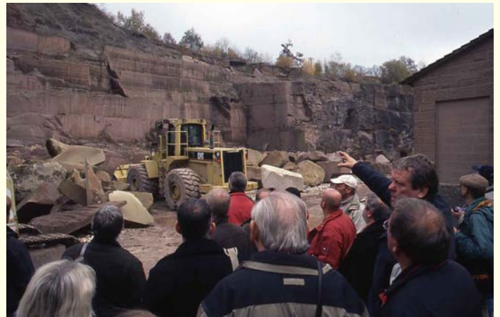
Abb. 4: Führung durch Steinbruch und Werk der Fa. Lauster Steinbau in Maulbronn anlässlich der ARKUS-Tagung 2009. Teilnehmer waren Steinmetze, Restauratoren, Denkmalpfleger, Planer, Fachleute der Gesteinsprüfung und Natursteinunternehmer.

Die vielfältigen Naturwerksteinvorkommen Baden-Württembergs und ihr traditioneller, heutiger und künftig möglicher Einsatz in Denkmalpflege, Technik und Architektur waren die Themen der ARKUS-Tagung am 29. Oktober 2009 im Haus der Wirtschaft in Stuttgart (Abb. 3) und bei den anschließenden Fachexkursionen zu Abbau- und Verarbeitungsstandorten im Land am 30. Oktober 2009 (Abb. 4). Die gute Kooperation der Veranstalter aus unterschiedlichen, beim Thema „Naturwerkstein“ zusammenarbeitenden Disziplinen sorgte für ein weit gefächertes Programm. Weitere Veranstaltungen für Natursteinindustrie, Denkmalpfleger, Restauratoren und die breite Öffentlichkeit sind geplant.