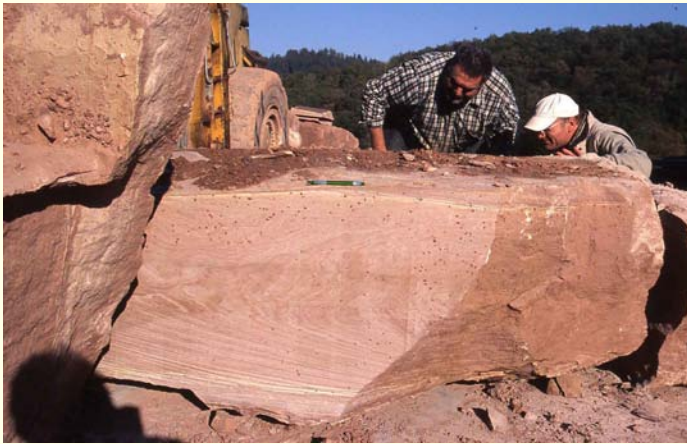
Abb. 1: Neckartäler Hartsandstein, ein für moderne Bauten wie für die Erhaltung von historischen Gebäuden begehrter, kieselig gebundener Sandstein aus dem südlichen Odenwald.

Seit Anfang der 1990er Jahre ist die Zahl der Werksteinbrüche um etwa 50 % zurückgegangen. Heute werden in Baden-Württemberg noch 46 Steinbrüche zur Gewinnung von Rohblöcken betrieben (Abb. 1). Die