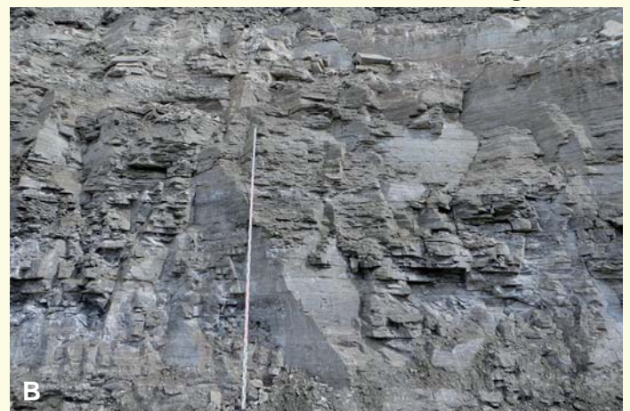
Abb. 1: Wichtige Massenrohstoffe für den Baubedarf: (A) Kiesablagerungen liefern hochwertige Rohstoffe für Hoch- und Tiefbau (Bsp. Kiesgrube Harthöfe, RG 7725-16). (B) Die Zementrohstofflagerstätten im Oberjura der Schwäbischen Alb gehören zu den größten Süddeutschlands (Bsp. Zementmergel im Steinbruch Bochingen, RG 7617-7).