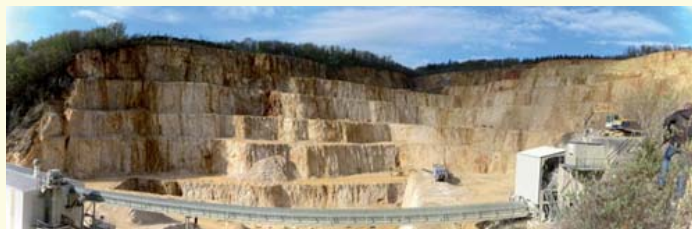
Abb. 2: Zu den Besonderheiten der Region gehören die mächtigen Kalksteinlagerstätten, die auch große Körper mit Kalken von > 99% CaCO 3 enthalten, welche für industrielle Einsatzbereiche (Papier, Glas, Pharmazie, Farben usw.) geeignet sind. Fotobeispiel: Stbr. Blaustein-Wippingen (RG 7525-9).

der Erkenntnisse zusammenfassend beschrieben und bewertet. Beispiele für in der Region Donau-Iller besonders wichtigen Lagerstättentypen zeigen Abbildungen 1 und 2.