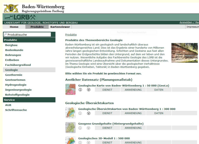
Abb. 1: Themenstartseite Geologie des LGRB Online-Shops.

Auf den Themenstartseiten des LGRB Online-Shops (s. Abb. 1) werden nun alle verfügbaren Produkte eines LGRB-Themas nach Produktgruppen sortiert aufgelistet