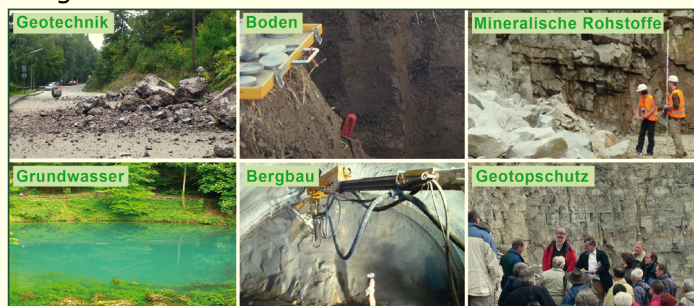
Abb. 1: Themen des LGRB, welche bei den TöB-Stellungnahmen berücksichtigt werden.

Das Landesamt für Geologie, Rohstoffe und Bergbau (LGRB) im Regierungspräsidium Freiburg wird in Anhörungsverfahren als Träger öffentlicher Belange im Rahmen von öffentlich-rechtlichen Verfahren beteiligt. Wir sind mit unserem geowissenschaftlichen Fachwissen kompetenter Ansprechpartner für öffentliche Planungsstellen, Genehmigungsbehörden sowie Ingenieur- und Planungsbüros. In unseren Stellungnahmen geben wir Hinweise zu verschiedenen Schutzgütern des Untergrunds, wie beispielsweise des Grundwassers oder des Bodens, und warnen vor potenziellen Gefahren, die von schwierigem Baugrund, Erdbeben oder Altbergbau ausgehen können.